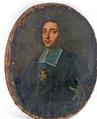
Portrait de Henry-Charles ARNAULD DE POMPONNE par Hyacinthe RIGAUD (1700) http://www.hyacinthe-rigaud.com/